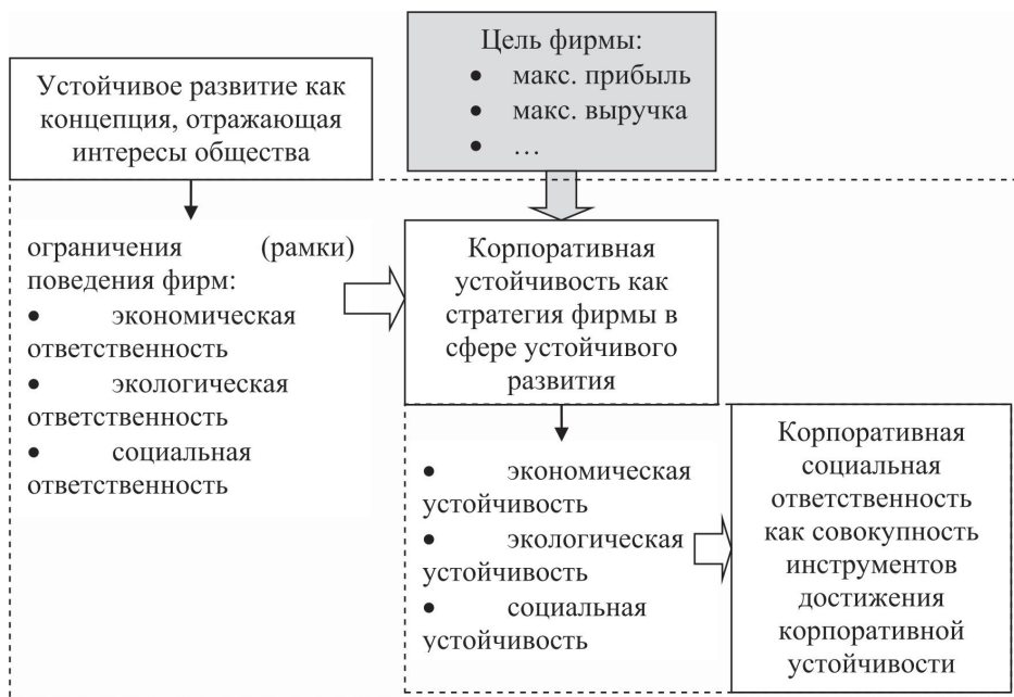
Рис. 2. Иерархия «устойчивое развитие – корпоративная устойчивость – корпоративная социальная ответственность» в контексте влияния на поведение фирмы