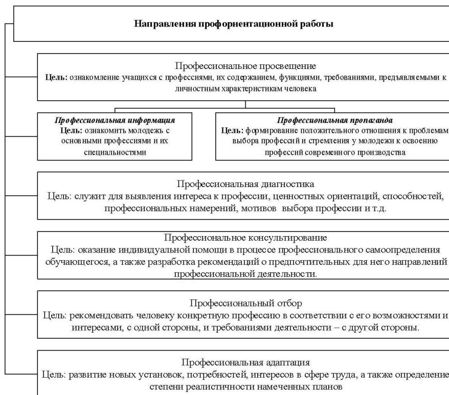
Рис. 1. Направления профориентационной работы